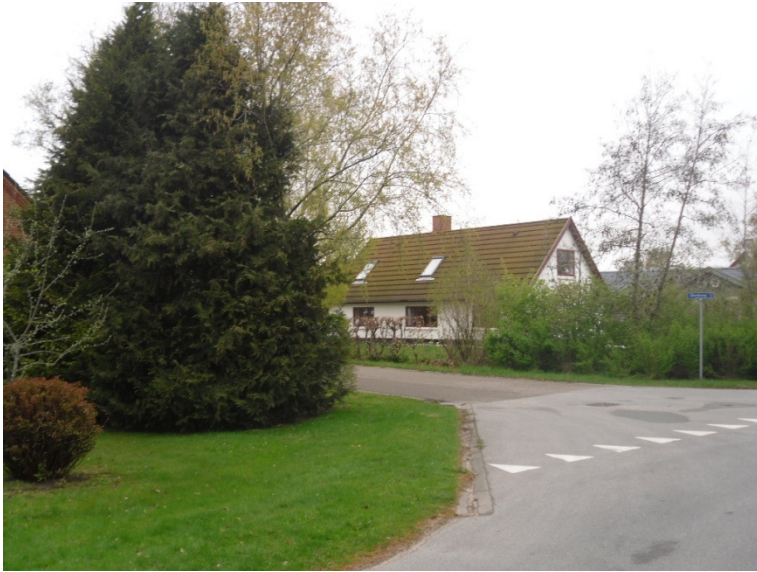
Kræn Hansensvej 2 sommeren 2010